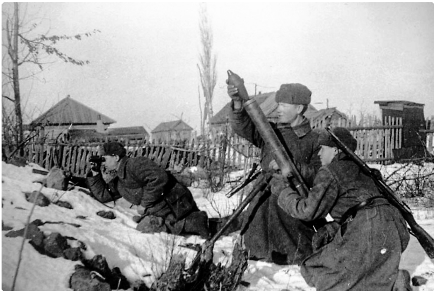
Расчет 82-мм миномета ведет огонь по противнику в окрестностях Сталинграда. Январь 1943 г.

в июле сорок второго шагал по раскаленному от полуденного солнца пыльному «дикому полю» навстречу грядущему, в котором были уже уготованы: кому – слава, а кому – неизвестность, кому – муки плена, а кому – донская земля... Не будет уже его, но будет воин, который вместе со всеми тогда просто выполнил приказ.