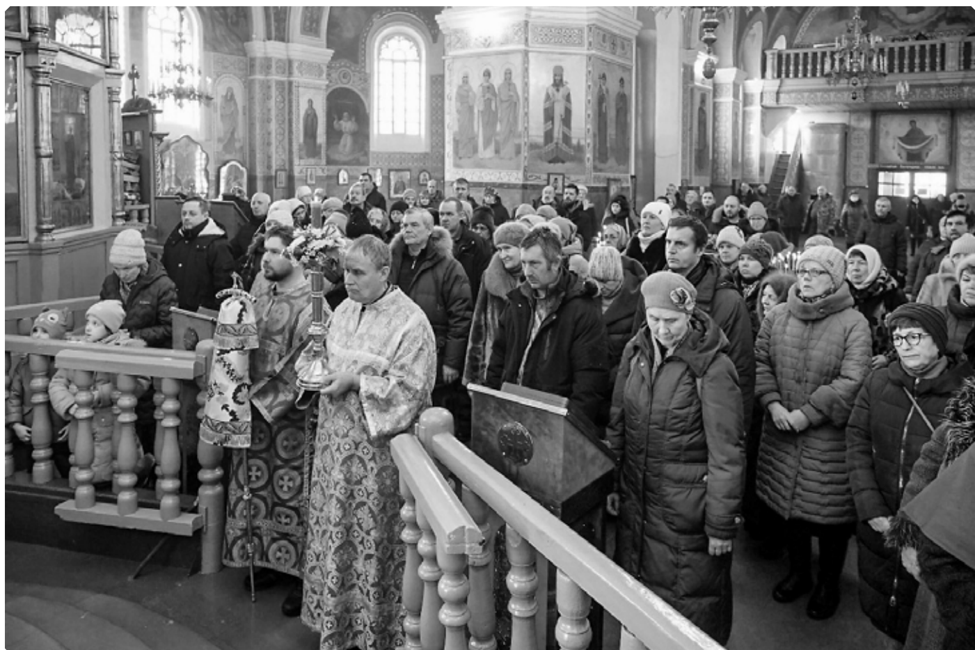
Прихожане Успенского кафедрального собора г. Бийска. Сретение Господне. 15 февраля 2023 г.

Иван Литвинов