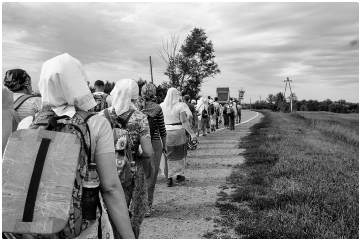
На пути от Ануйского до Верх-Ануйского. 27 июня 2022 г.

нас ждут села: Хлеборобное, Верх-Ануйское, Новопокровка, Паутово, Николаевка. О них рассказать еще предстоит.