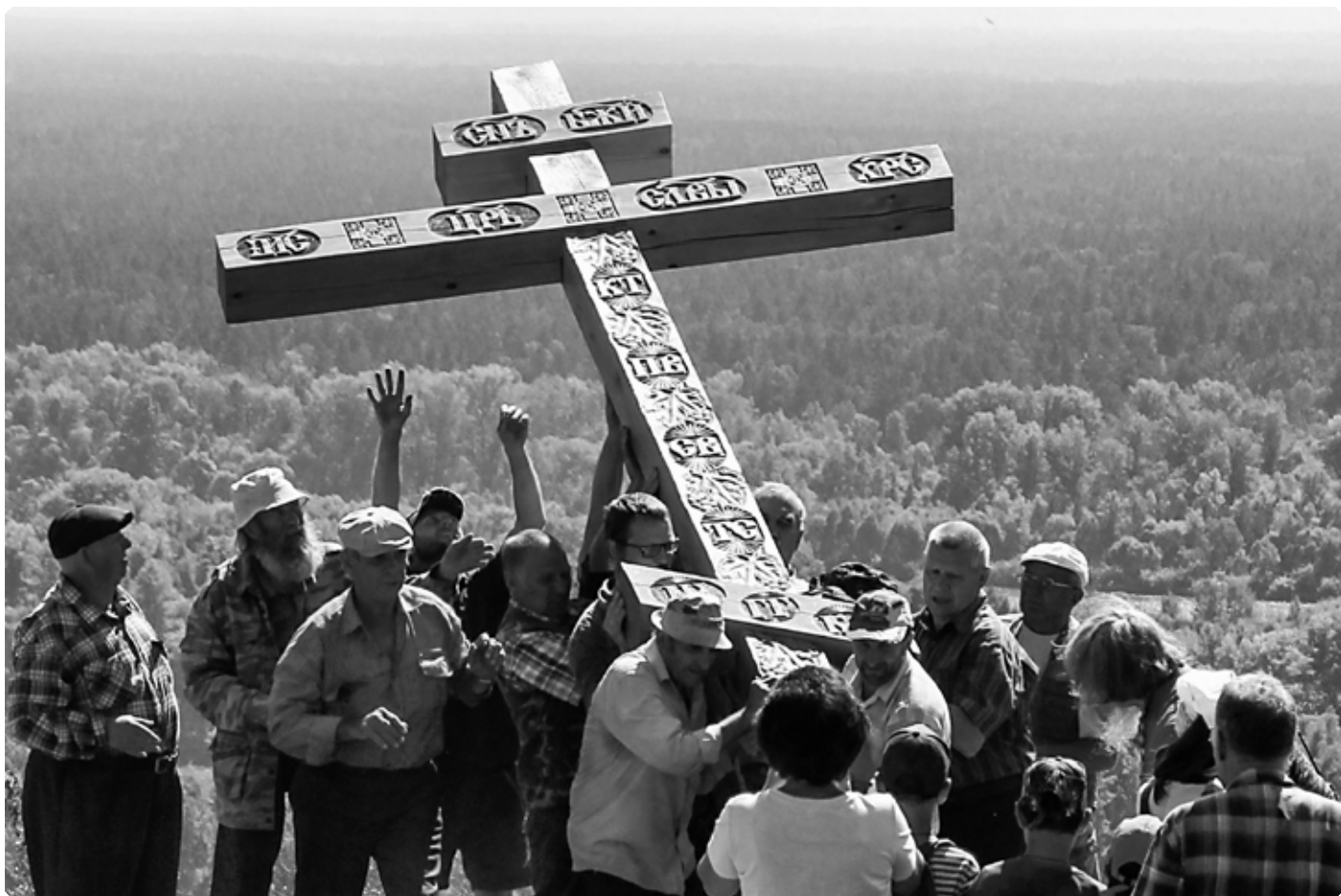
Установка поклонного креста. Гора Солонец, Солтонский район. 17 августа 2020 г.