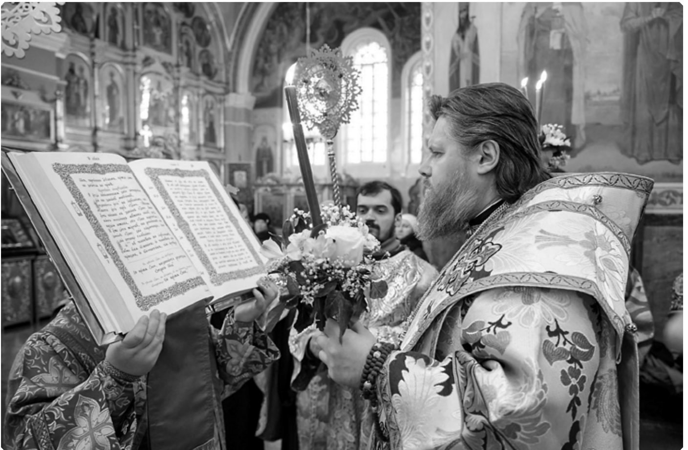
Всенощное бдение в канун праздника Сретения Господня. 14 февраля 2023 г. Успенский кафедральный собор г. Бийска