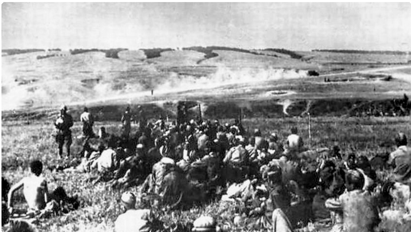
Прифронтовой лагерь советских военнопленных. Район г. Калач-на-Дону.

в окоп, я побежал по нему в сторону берега. Следом за мной спешили уцелевшие ребята из моего взвода и несколько наших пехотинцев. В свете ракеты успели заметить выскочившую на нас из-за поворота окопа группу немцев. Я нажал на спусковой крючок трофейного автомата, но выстрелов не последовало: кончились патроны. Передний из фрицев бросил мне под ноги гранату. Помню мелькнувшую мысль – отбросить ее. Не успел. В глазах ослепительная вспышка и за ней полная тьма...»