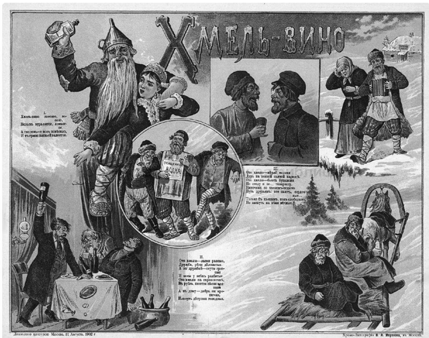
Дореволюционный антиалкогольный плакат «ХМЕЛЬ-ВИНО. Хмель-вино спесиво, весело, всласть куражится, ломается. А глядишь – и нос повесило, и в грязи свиной валяется...» Хромолитография изд. И.А. Морозова. Москва. Дозволено цензурой 31 августа 1902 г.