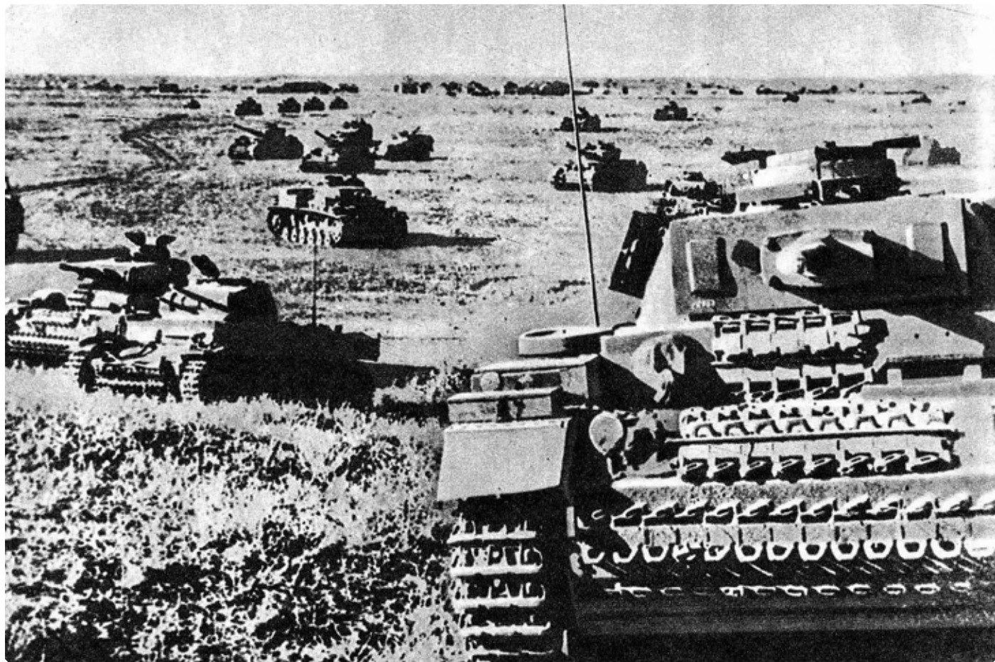
Немецкие танковые армады рвутся к Сталинграду. Лето 1942 г.

«Несколько наших дивизий в это время попали в окружение за Доном, – продолжает свой рассказ ветеран, – противник, захватив переправы, двинулся по степным просторам на Сталинград. Все мы, от комдива до солдата, жили одной мыслью: вырваться из окружения к Дону и снова сражаться. Было принято решение в ночь с 9-го на 10-е августа идти на прорыв. Мой 804-й стрелковый полк шел вторым. Стояла кромешная тьма, лишь вспышки от выстрелов и разрывов гранат на мгновение выхватывали окружающее из черноты ночи. В окопах на берегу Дона завязались рукопашные бои. Стоны раненых, крики, предсмертные хрипы, русская и немецкая брань огласили ночное побоище. Прорвавшись