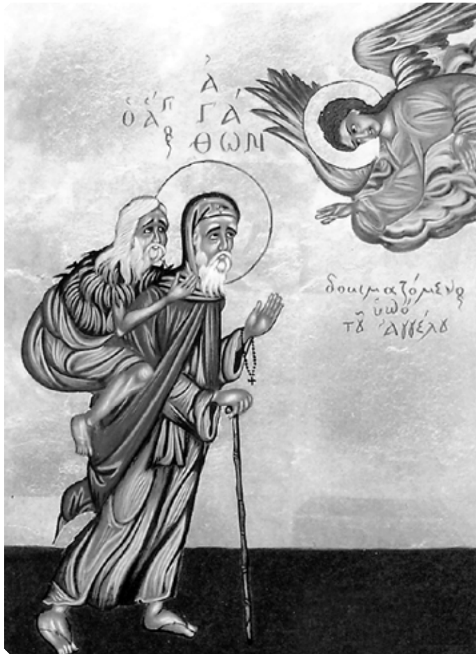
Преподобный Агафон Скитский (Египетский), пустынный

«Однажды авва Агафон, пойдя в город для продажи небольших сосудов, нашел на дороге прокаженного. Прокаженный спросил его: “Куда идешь?”