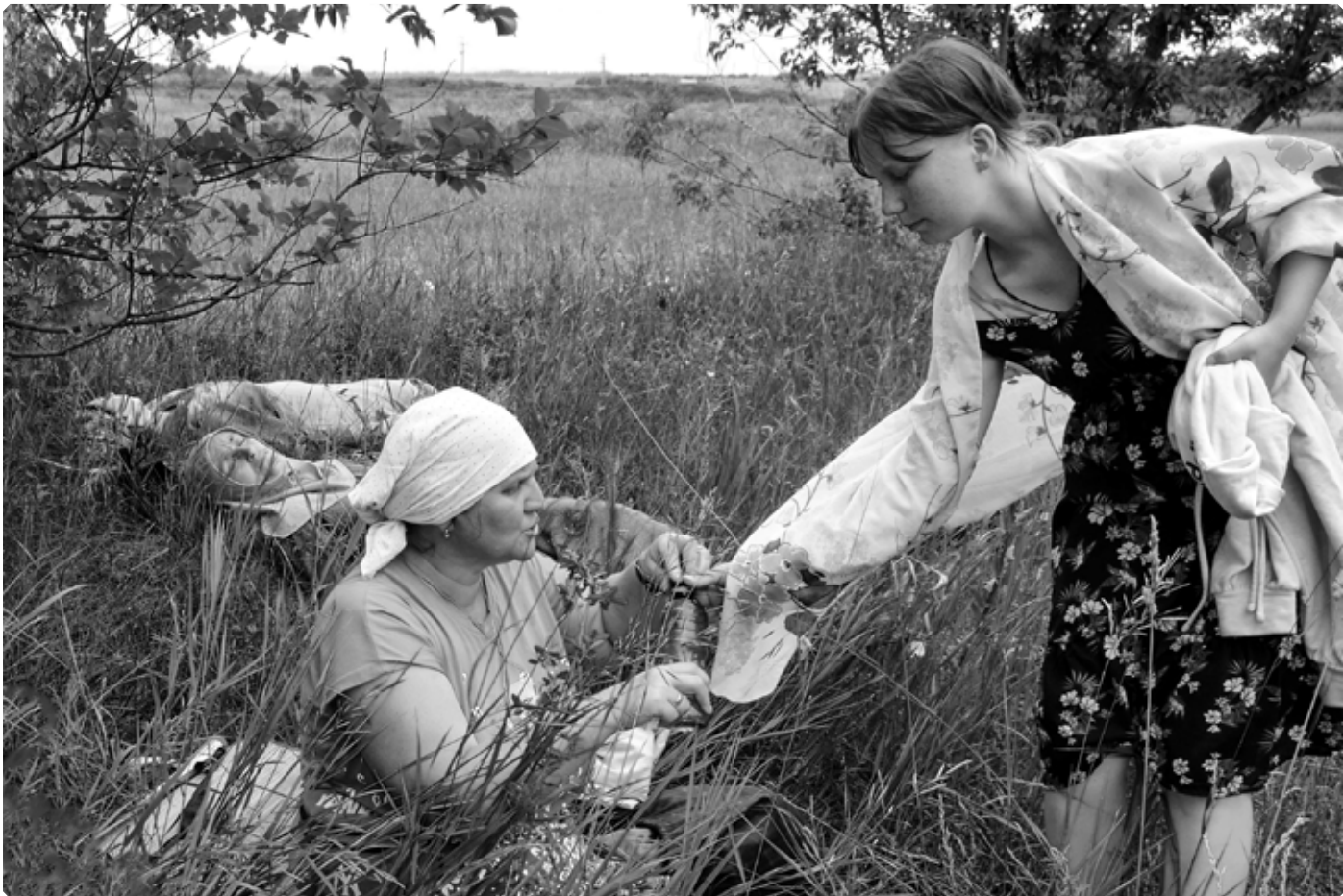
Привал. 27 июня 2022 г.

Вскоре святая река Церкви Российской возшумела в явлении полной Славянской Библии; вскоре потоки ее, от изобилия и стремления вод проникли в глубины земли и там возгремели чудесами проповеданных отцов Антония и Феодосия; вскоре пещеры, не вмещающая того же изобилия живой воды, текущей в вечную жизнь, произвели родники, пробившиеся на поверхность земли, журчавшие любезными образами послушания, смирения, бескорыстия, целомудрия, трудолюбия, братолюбия, незлобия, молитвы, поучения в слове Божиим и другими добродетелями...»