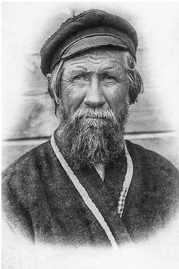
Сибирский крестьянин. 1920-е гг. // Алтайский крестьянин. – 2020. – № 2. – С. 1.

В заметной части современной российской православной среды с постперестроечных лет