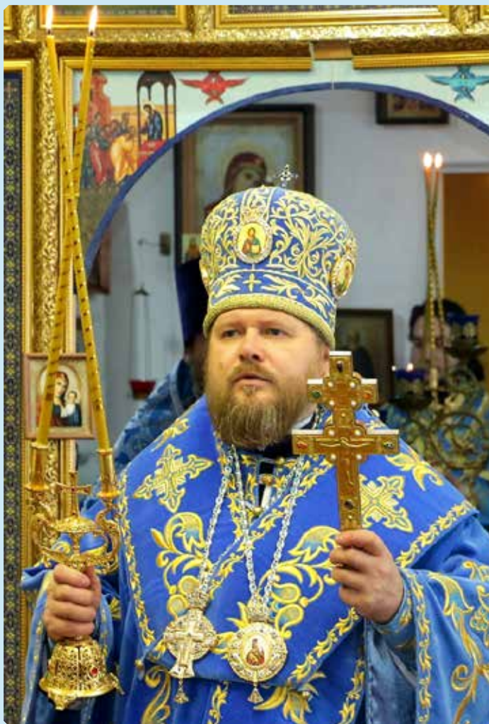
Преосвященный Серафим, епископ Бийский и Белокурихинский. Сретение Господне. 15 февраля 2020 г.

Ныне мы вспоминаем событие, имеющее огромное духовное значение: встречу в Иерусалимском храме праведного старца Симеона и Богомладенца Иисуса – символическую встречу Ветхого и Нового Заветов. Сретение Господне – это светлый и радостный праздник встречи человеческой души с Богом. Эта встреча-сретение происходит в жизни каждого из нас. Она может произойти тогда, когда человек впервые в жизни возьмет в свои руки Священное Писание, впервые исповедуется... У кого-то она случится тогда, когда первый опыт воздержания, покаяния и молитвы в дни Великого поста позволит с радостью войти в Светлую Пасху и литургически пережить Сретение с Господом.