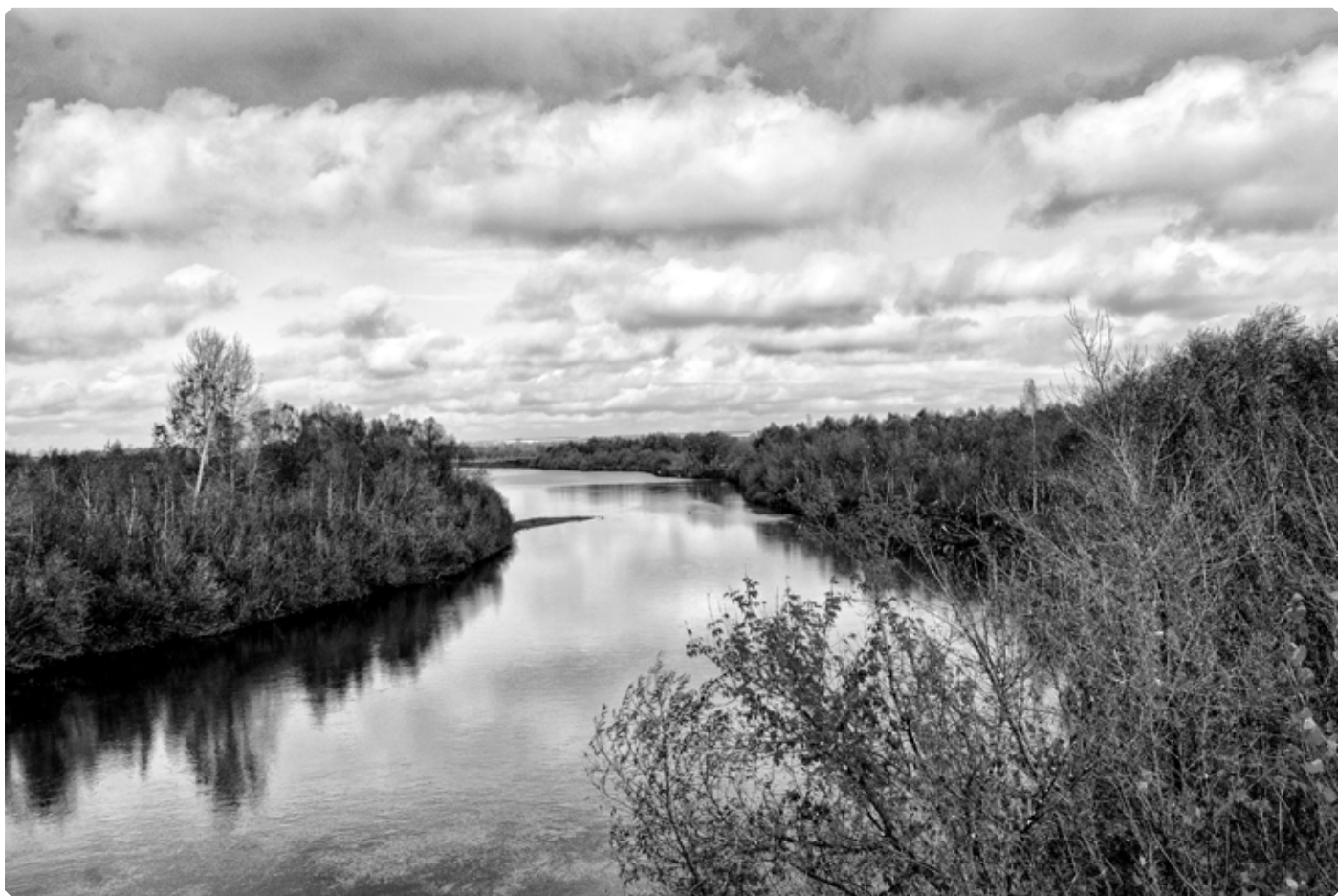
Река Ануй в окрестностях села Верх-Ануйское. 1 октября 2022 г.

Не сразу Ануй становится таким, каким мы встречаем его в описании Штейнфельда. В верхнем своем течении это горная река, берущая начало на склонах Ануйского хребта, расположенно-