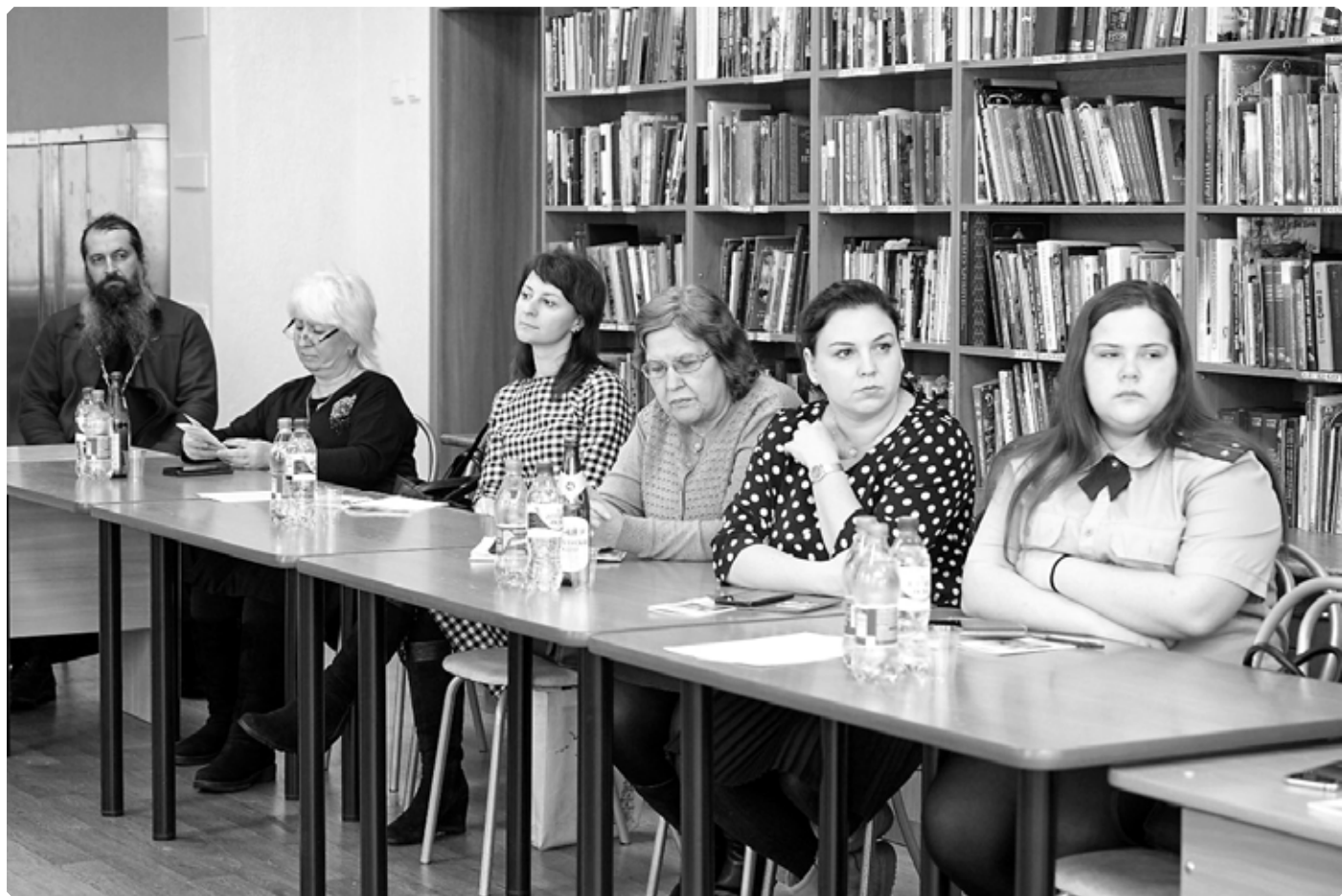
Участники круглого стола.

Бийск. Духовно-просветительский центр «Возрождение». 20 января 2023 г.